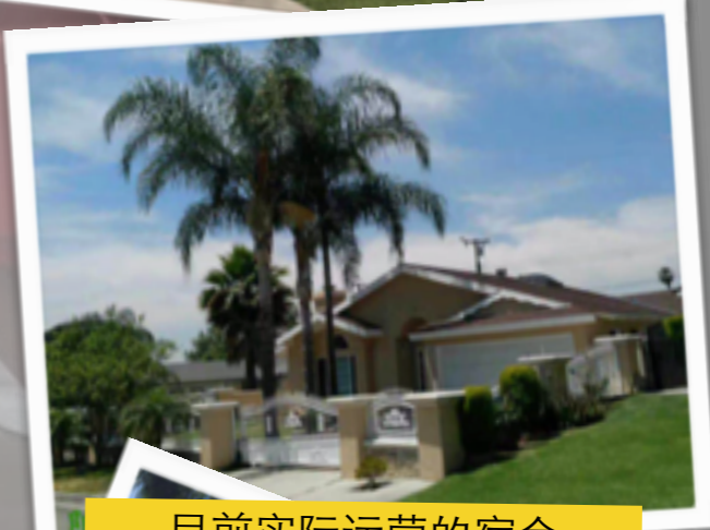
目前实际运营的宿舍