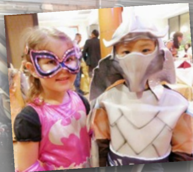
目前我们学员们照片